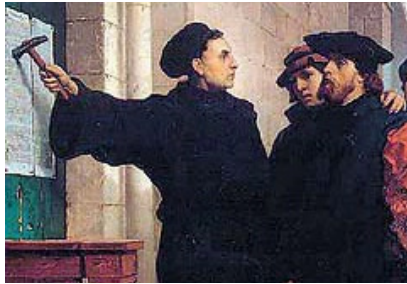
31 Oct. 1517, Lutero clavó las 95 tesis contra la venta de indulgencias