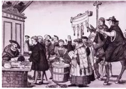
Venta de indulgencias

Martín Lutero falleció el 18 de febrero de 1546, en la ciudad Eisleben, Alemania.