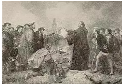
Lutero quemando la bula del Papa León X