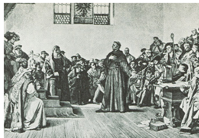
Lutero en la Dieta de Worms frente al Emperador Carlos V.